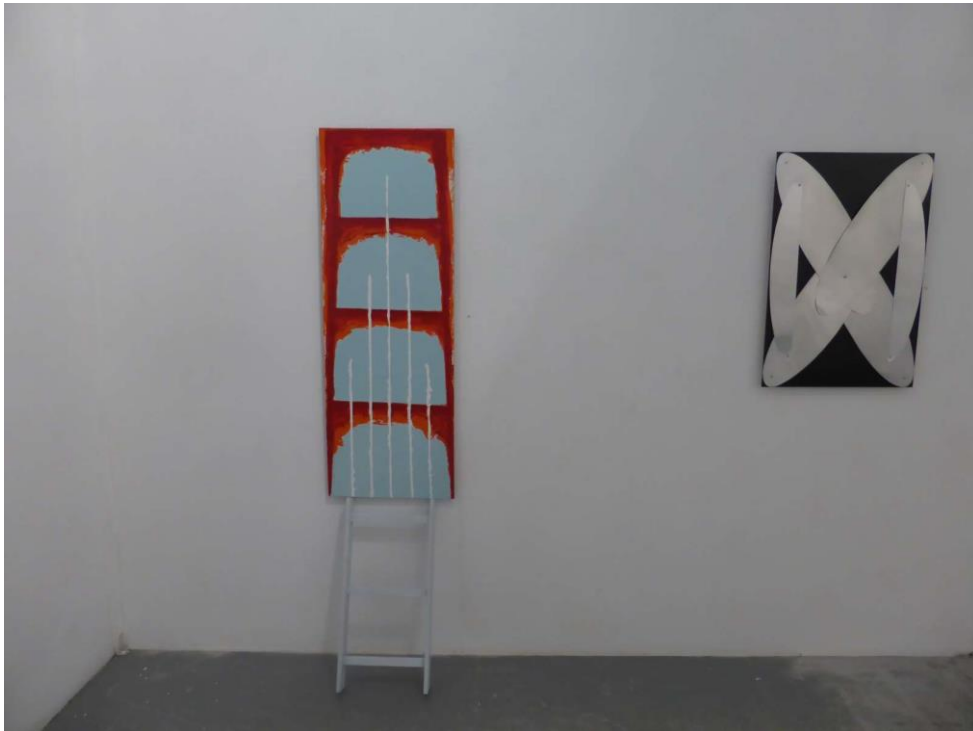
2 werken van Eric Knoote

In het weekend van 8 t/m 10 juli presenteerde Willem Wolff een overzicht van zijn beeldend werk in een Weekendsalon bij WG Kunst onder de titel Bricollages. In zijn werk richt hij zich op structuur en ritme.