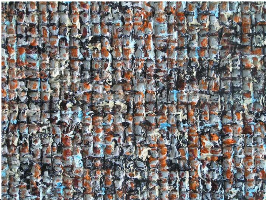
Werk van Willem Wolff

In het weekend van 8 t/m 10 juli presenteerde Willem Wolff een overzicht van zijn beeldend werk in een Weekendsalon bij WG Kunst onder de titel Bricollages. In zijn werk richt hij zich op structuur en ritme.