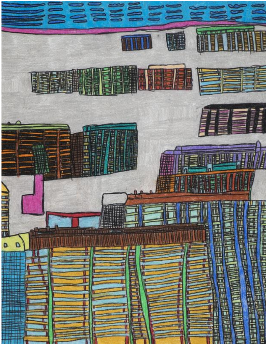
Jefke Dijkstra, Stratenstad, 2014, oliepastel op papier, 65 x 50 cm

Tegelijkertijd met de tentoonstelling in WG Kunst werd werk geëxposeerd in het Loyd Hotel, de Culturele Ambassade en Cocomat op de Overtoom. Binnen de tentoonstellingsperiode werden presentaties en rondleidingen gehouden.