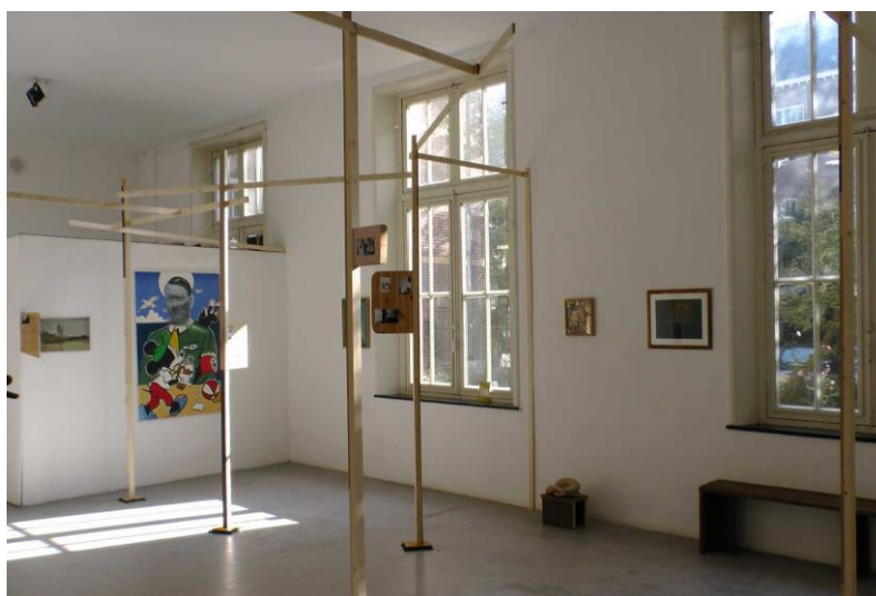
een gedeelte van de installatie van Jeroen Kee

In de zomer van 2015 vond het eerste deel "Mijn Favoriet" plaats, waarbij favoriete kunstwerken van buurtbewoners bij WG Kunst te zien waren. Als vervolg werd nu in WG Kunst een installatie gerealiseerd met daaraan toegevoegd enkele interactieve elementen, zoals een 14-tal luisterroutes door de buurt met door schrijvers ingesproken teksten, geïnspireerd op ingezonden kunstwerken. Ook waren er raamexposities in de buurt te zien. Daarnaast was de interactieve website thesecretlifeofart.nl , waarop buurtbewoners hun bijdrage konden zetten, onderdeel van het project. De installatie was van 9 t/m 31 januari te zien bij WG Kunst.