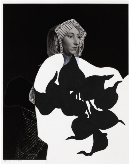
'Anna Boleyn' van Jelle Kampen

In het weekend van 9 t/m 11 december was de Weekendsalon van Jelle Kampen. Hij toonde een selectie van zijn Werken op papier 2003 – 2016. Een succesvolle tentoonstelling die een vervolg krijgt in 2017.