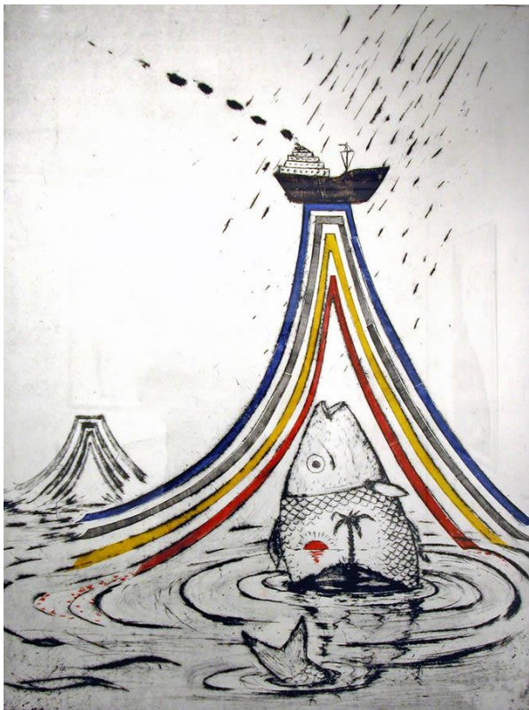
Een ongewone was van het zeewater Compier Wim, ets

In het kader van deze tentoonstelling vond samenwerking plaats met Art Trust (thans: Stichting Digitaal KunstBeheer), die zich ten doel stelt om met digitale middelen het voortbestaan van het werk van (overleden) kunstenaars te realiseren.