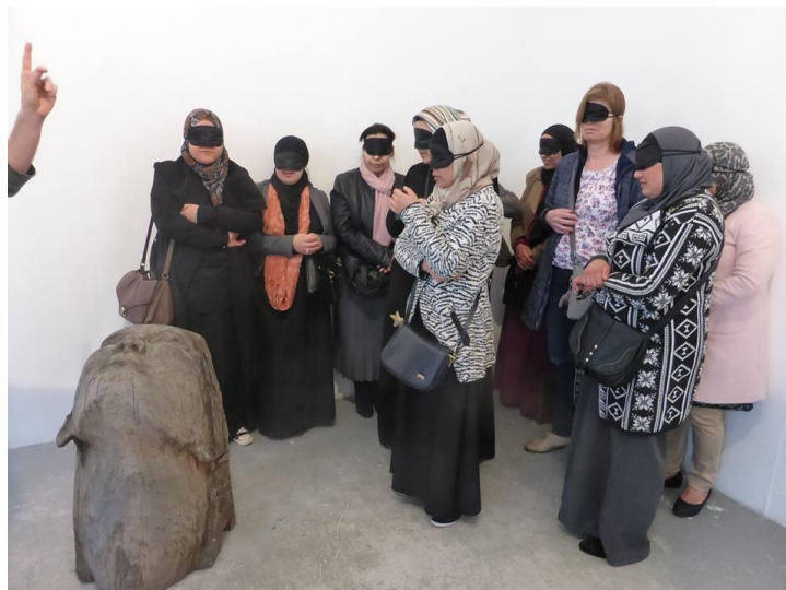
Workshop groep ‘moeders’ van de Burgemeester de Vlugtschool

In de periode 15 april t/m 8 mei organiseerde WG Kunst haar eigen project “Pakkend Beeld” , een tentoonstelling met werk van vijf hedendaagse beeldhouwers in een als installatie vormgegeven expositie. De expositie nodigde nadrukkelijk uit om de beelden aan te raken.