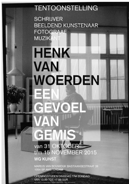
Affiche bij de tentoonstelling

Als eerbetoon en ter herdenking heeft een groep vrienden het initiatief genomen om twee exposities rond deze bijzondere kunstenaar te organiseren, in het Letterkundig Museum in Den Haag en in WG Kunst. Bij de tentoonstelling verscheen een (gratis) publicatie. De tentoonstelling bij WG Kunst duurde van 30 oktober t/m 15 november.