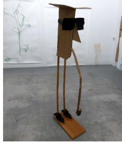
kartonnen figuur Van Heerikhuizen