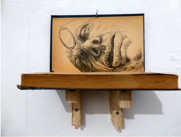
End page Aart Taminiau