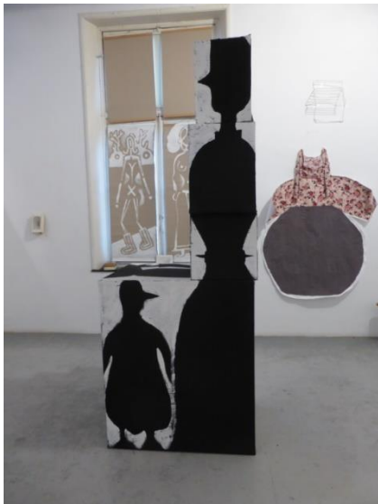
Pinguins van Wasco