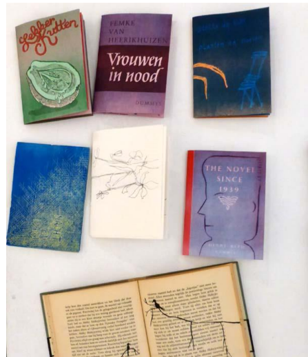
de serie van 6 uitgebrachte boekjes