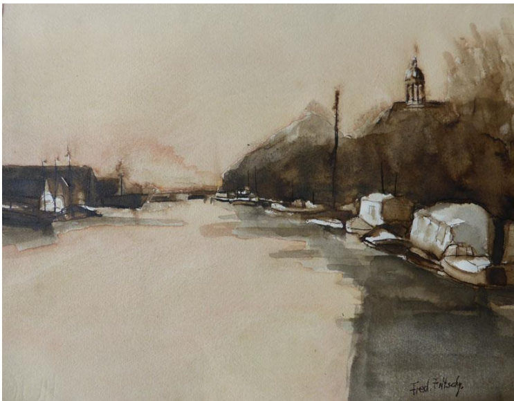
Stadsgezicht (aquarel) van Fred Fritschy

De tentoonstelling bestond uit schilderijen op doek, aquarellen op papier, tekeningen, grafiek en enkele bijzondere foto's. Van elke geselecteerde kunstenaar waren meerdere werken te zien en te koop. Onderstaande afbeelding van Fred Fritschy is voor het affiche en de flyer gebruikt.