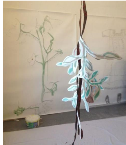
papieren hangplanten Ebelina Brethouwer